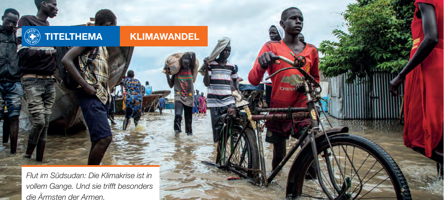
Flut im Südsudan: Die Klimakrise ist in vollem Gange. Und sie trifft besonders die Ärmsten der Armen.