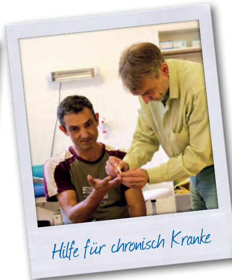
Hilfe für chronisch Kranke